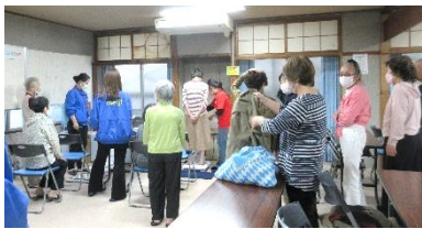
筋肉量測定にドキドキ。