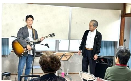
優しい歌声に癒されました。