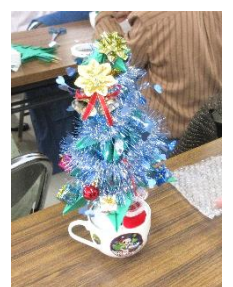
可愛いツリーが 出来ました♪