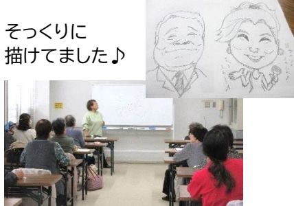
そっくりに 描けてました♪