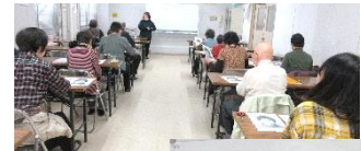
特徴を 捉えて そっくり♪