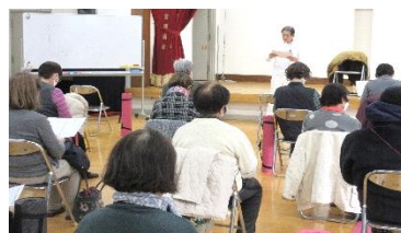
年末年始に向けて、食べ過ぎ防止の テクニックについての講座でした。