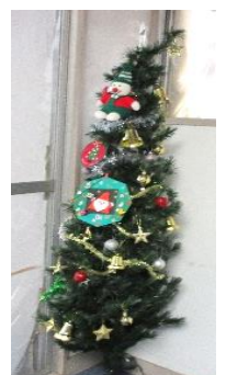
綺麗に 飾り付けて いただきました♪