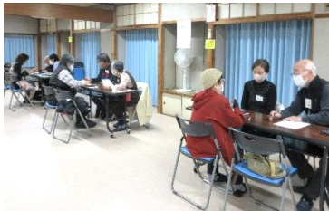
お悩み解決で、スッキリ♪