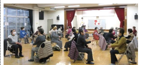
太鼓に合わせて手拍子・足踏み♪