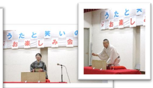
歌って、笑って 楽しみました♪