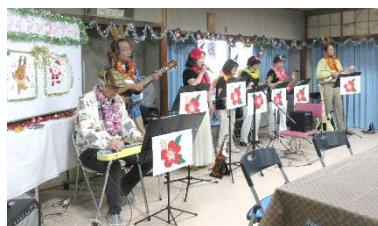
ハワイアンムードたっぷりでした♪