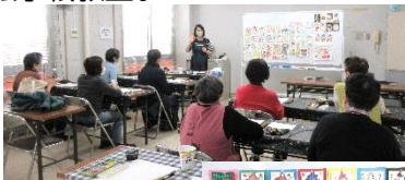
すてきな作品が 出来上がり ました♪