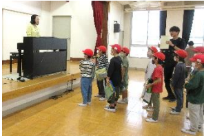
ありがとう♪また来てね😊

10月30日(水) 世代間交流事業 「町たんけん」 で 西淡路小学校2年生の皆さんが来館♪